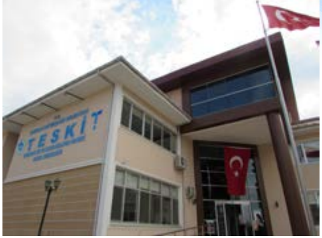
TESKİ Genel Müdürlüğü Ana Hizmet Binası

Su borçlarınızı anlaşmalı olduğumuz banka kredi kartları ile taksitlendirebilirsiniz.