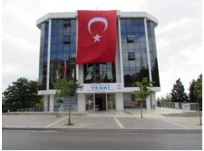
TESKİ Genel Müdürlüğü Ek Hizmet Binası